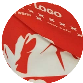
LATO ESTERNO / OUTERSIDE

"Warm" the tubular neck-warmer made with high quality technical, bi-elastic fabric, produced by a prestigious Italian weaving mill. Designed to combine lightness with comfort, it guarantees full freedom of movement, abrasion resistance, high breathability and excellent insulating and thermal properties.