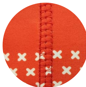
CUCITURA PIATTA / FLAT SEAM

La confezione prevede applicazione di etichetta composizione/lavaggi/Made in Italy con ulteriore cucitura a tre aghi piatta di copertura che migliora il comfort mentre lo si indossa. Il packaging prevede un imbusto singolo in sacchetto PP o, su richiesta, sacchetto in LDPE riciclato o carta Kraft riciclata.