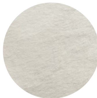
LATO INTERNO / INNERSIDE

Un lato liscio, personalizzabile mediante stampa sublimatica, con inchiostri ad acqua certificati. Un lato garzato, morbidissimo e piacevole sulla pelle. È un prodotto certificato Oeko-tex 100 classe 1.