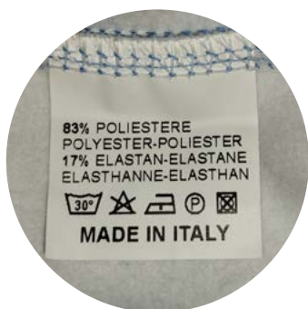
ETICHETTA PERSONALIZZATA / CUSTOMIZABLE LABEL

Tubular neck warmer made with high quality technical, bi-elastic fabric, produced by a prestigious Italian weaving. Designed to combine lightness with comfort, it guarantees full freedom of movement, abrasion resistance, high breathability and excellent insulating and thermal properties.